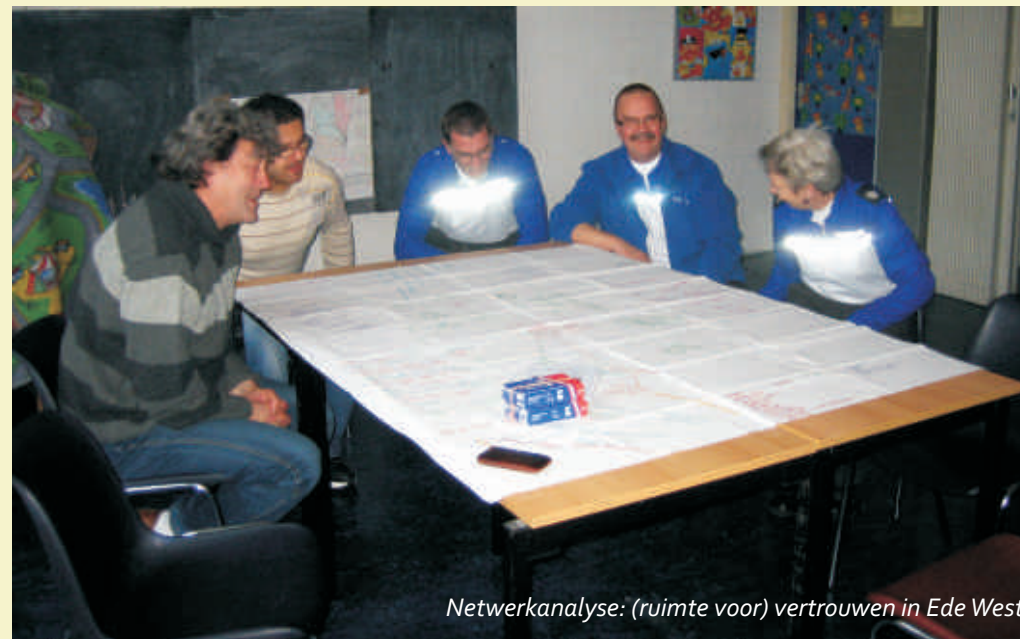
Netwerkanalyse: (ruimte voor) vertrouwen in Ede West