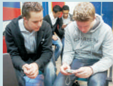
Jongeren maken filmpjes en foto's van Rhenen.