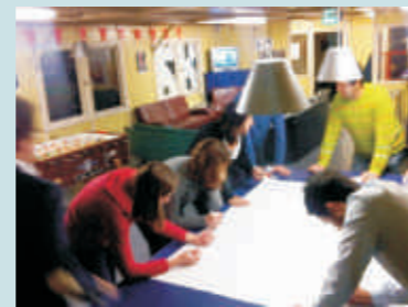
Netwerkanalyse jongeren en politici.